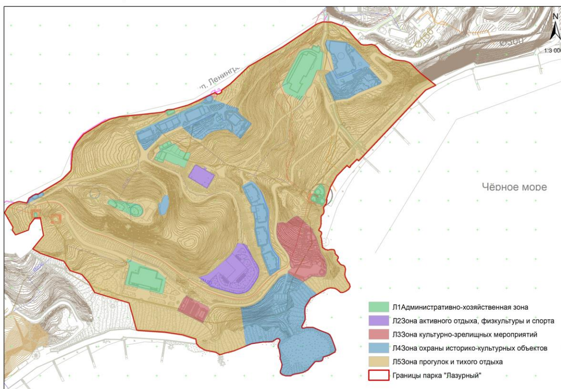
СХЕМА РАСПОЛОЖЕНИЯ ФУНКЦИОНАЛЬНЫХ ЗОН ПАРКА-ПАМЯТНИКА САДОВО-ПАРКОВОГО ИСКУССТВА РЕГИОНАЛЬНОГО ЗНАЧЕНИЯ "ЛАЗУРНЫЙ"